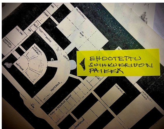
Tähän loppuvat jäljet suihkukaivosta.

kaupunki oli yhä hiljaa, teoksen osat siirrettiin Laajasaloon autotallivarastoon.